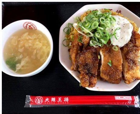
8月29日（木）棋戦での提供商品