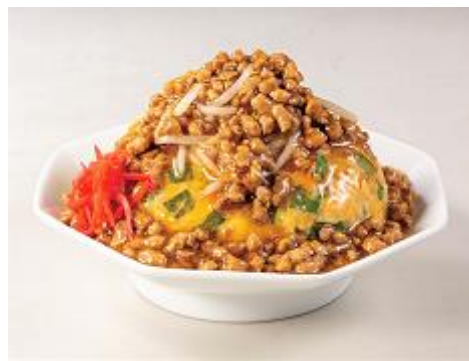
7 月 18 日、9 月 30 日、10 月 7 日 棋戦中にご提供