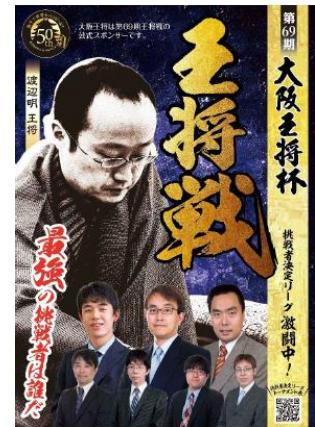
大阪王将杯王将戦 挑戦者決定リーグ